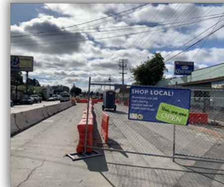
Business are open during construction Los negocios siguen abiertos durante la construcción