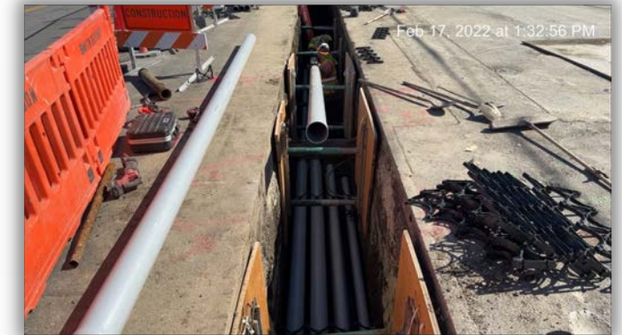
Joint Trench: moving utilities conduits underground Zanjas de articulación: conductos de utilidades subterráneos