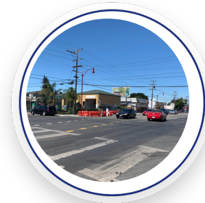
Corner of Pacific Ave and Middlefield Road. Spring 2022 / Esquina de Pacific Ave y Middlefield Road. Primavera 2022