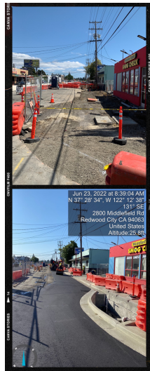
Corner of Pacific Ave & Middlefield Rd

Old + new sidewalk between Dumbarton & 1st Ave.